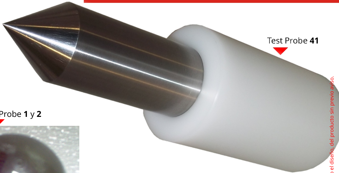
Test Probe 41