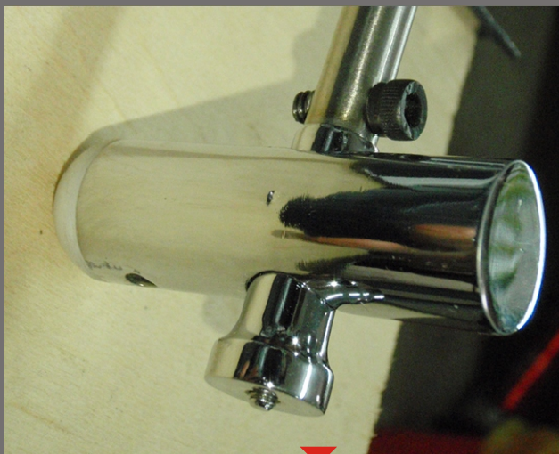
Elemento de impacto