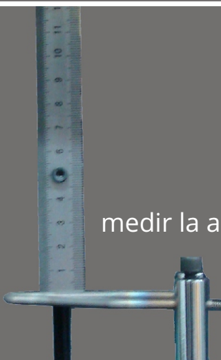
Regla para medir la altura de llama